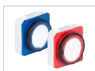
Leicht zu warten